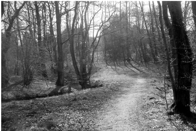
Astrup Bæk : Ilford FP4, Kodak D-76, Canoscan, Paint Shop Pro

Brugtprisen på Ebay for de første typer er efter min mening generelt for høj, de sælges på deres sjældenhed og udseende.